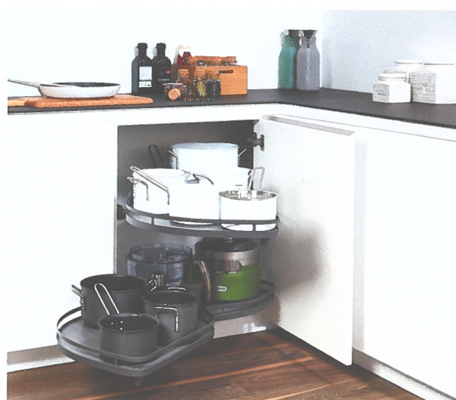
De antracietkleur geeft de LeMans hoekkastinrichting een trendy look.