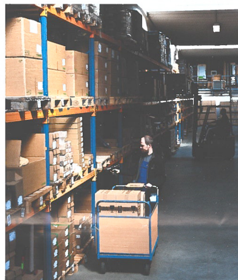
Vanuit dit magazijn, 5.000 m 2 groot, worden alle bestellingen via geautomatiseerde processen in combinatie met bekwame magazijniers, in 'real-time & paperless' afgehandeld.