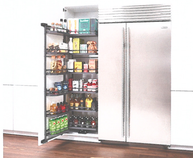
De nieuwe Kesseböhmer Tandem kastinrichtingen, ideaal voor voorraadkasten van 45 tot 60 cm breed en ook verkrijgbaar in antraciet.